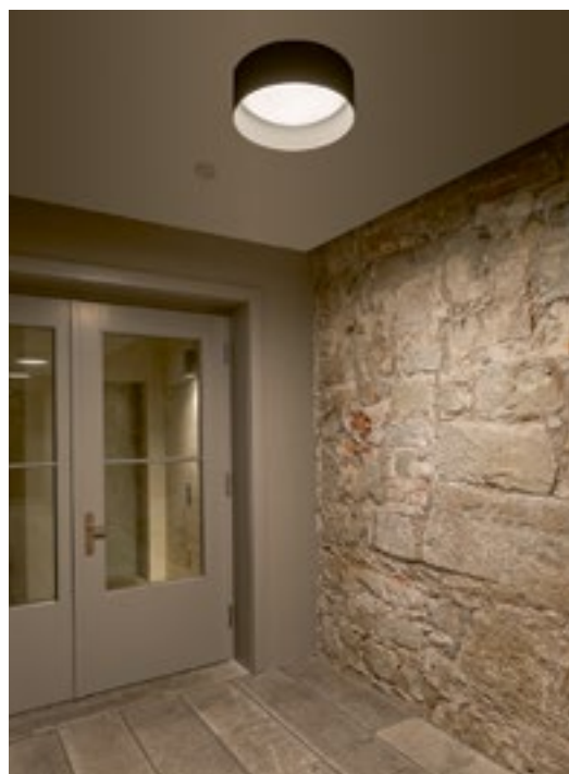
La zone d'accès dotée de maçonneries rustiques est éclairée par une lumière diffuse qui renforce le sentiment de sécurité.