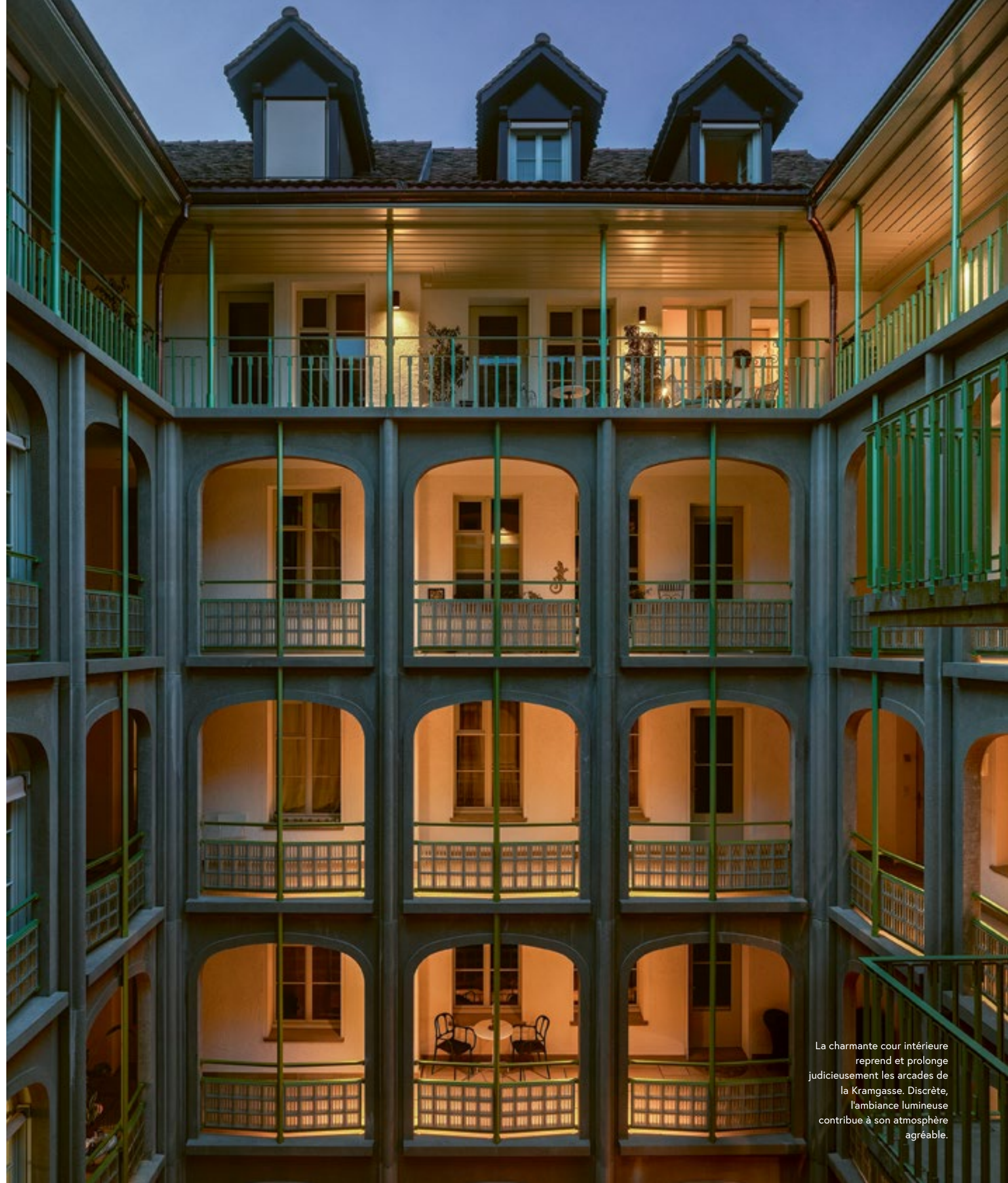
La charmante cour intérieure reprend et prolonge judicieusement les arcades de la Kramgasse. Discrète, l'ambiance lumineuse contribue à son atmosphère agréable.

Le concept d'éclairage est le fruit d'une co-création dynamique et inspirante entre le bureau d'architectes et Neuco en sa qualité de spécialiste de l'éclairage. «C'était un processus remarquable, qui a été adapté et optimisé en permanence – avec beaucoup de passion», se